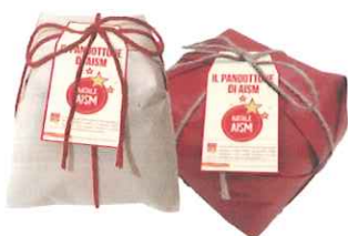
Pandoro e panettone 500 gr. offerta 10 €

Anche quest'anno tornano i regali solidali di AISM per Natale: gli ottimi panettoni e pandori artigianali, già assaggiati e apprezzati lo scorso anno, e le stelline decorative. In magazzino abbiamo poi ancora diversi peluches di vari soggetti.