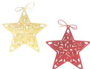
Stelline decorative offerta 2 €