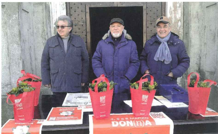
"GLI AMICI DI SOLERO" generosi collaboratori di AISM

Vi preghiamo, pertanto, di fare il passa-parola richiedendo personalmente ai negozi che frequentate (panettiere, macellaio, fruttivendolo, parrucchiere, ecc.) di prendere almeno un cartone di gardenie e farsi promotori della nostra campagna. E' importante informarli che potranno far valere l'offerta nella dichiarazione dei redditi del 2022. Siamo certi che non ci farete mancare la vostra solidarietà.